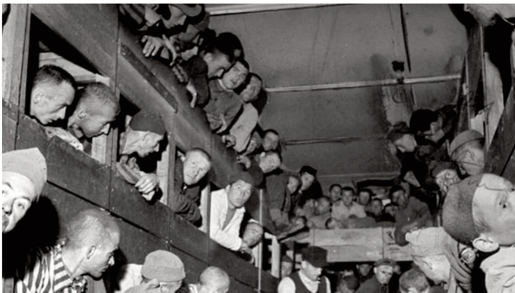
Los 88 sevillanos asesinados en campos de concentración nazis

Aprovecharemos, a ver cuánto dura la tranquilidad.