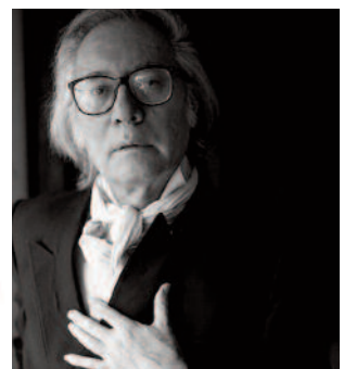
Francisco Umbral. Poeta, periodista, novelista, biógrafo y ensayista español.

“ Yo he venido aquí a hablar de mi libro ”