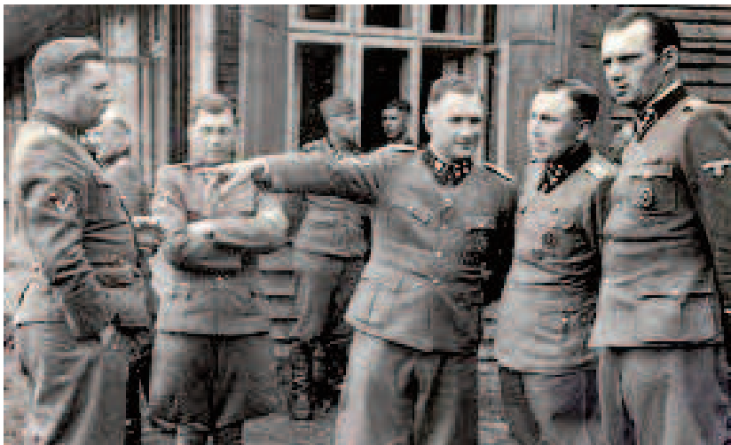
Oficiales nazis en Auschwitz: de izquierda a derecha, Josef Kramer, Josef Mengele, Richard Baer, Karl Hoecker y un mando aún sin identificar