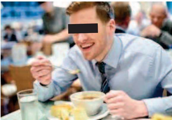
Ocultamos su identidad para preservar su anonimato

Es irrespetuoso y vergonzoso, además de denotar una falta de preocupación profesional en su labor y pérdida de credibilidad en sus funciones.