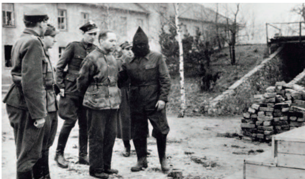
Höss, Comandante del campo de concentración de Auschwitz, segundos antes de ser ahorcado.

No me queda más que irme con mi orgullo a otra parte y militar en un bando con más valor humano, donde respeten voluntades y permitan desarrollar mi alma que, aunque sucia por obligación militar cada uno es responsable de sus actos y yo, tarde o temprano, daré cuentas de ello al diablo.