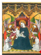
Virgen con el Niño. Tabla central del Retablo de la Vida de la Virgen y de San Francisco. Museo Nacional del Prado, Madrid

Esto se traduce en un ambiente de trabajo estresante que produce malestar y miedo. No nos podemos permitir perder días de sueldo y mucho menos perder el trabajo. Desde CGT os pedimos que no os calléis, no bajéis a su nivel perdiendo los papeles y las formas, trasmitírselo a nuestrxs delegadxs, nadie tiene derecho a trataros mal, y CGT hará lo posible y lo imposible para que esto cambie.